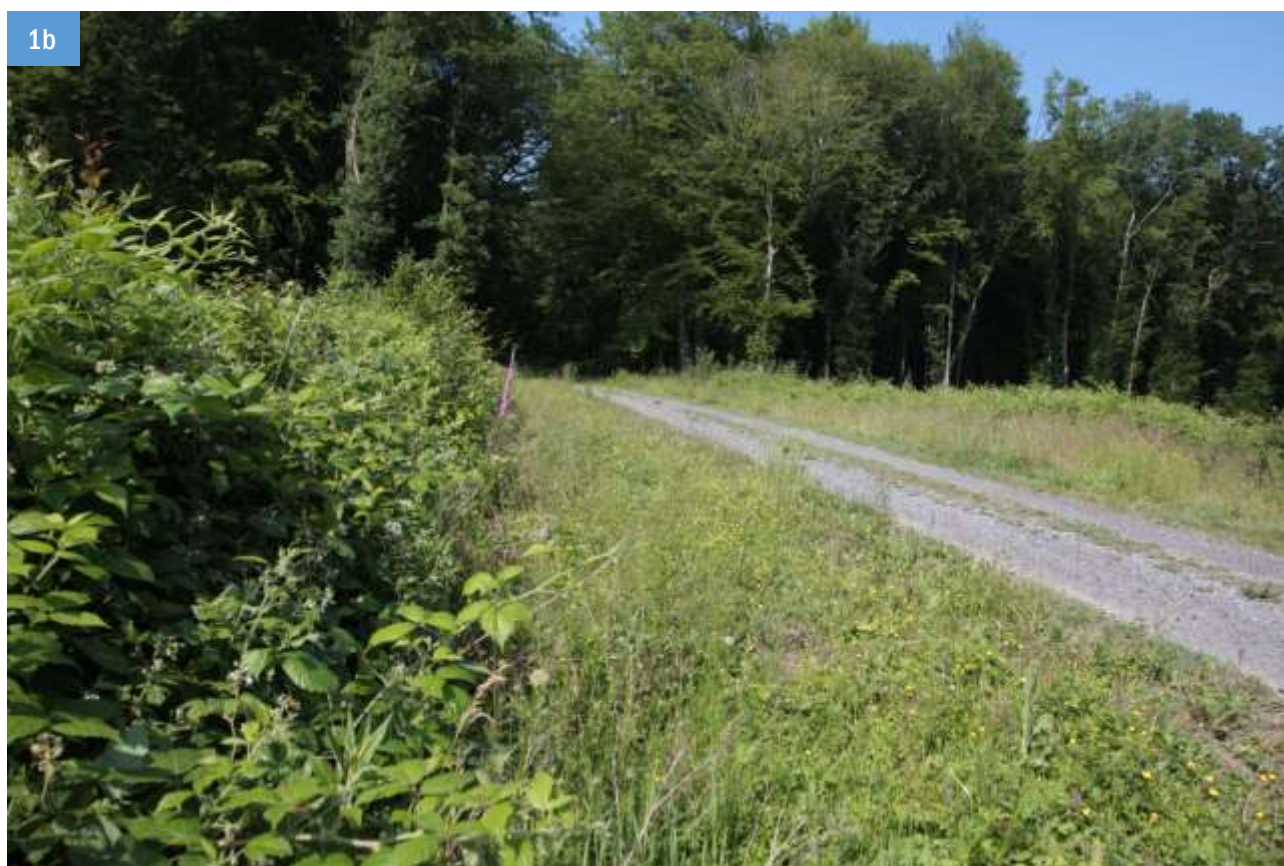
Figure 1. Principaux types de milieux prospectés. 1a - Bord de route secondaire dans le bocage, commune de Watigny (La Fosse aux loups), ancienne voie de chemin de fer macadamisée. 1b - Bord de chemin forestier, commune de Saint-Michel en Thiérache, (Route des Faux), aperçu après une coupe à blanc sur une petite parcelle.