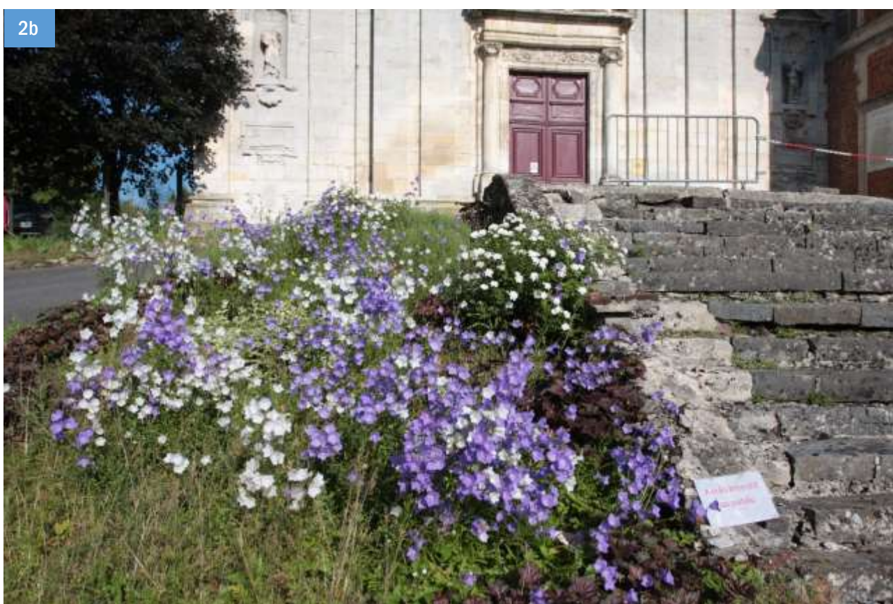
Figure 2. Types de milieux occasionnellement prospectés. 2a - Prairie bocagère, commune de Watigny (la Forge de Saily), milieu riche en chardon à proximité de la rivière Le Gland. 2b - Massif fleuri de plante horticole du genre Campanula , abord de l'abbaye de Saint-Michel en Thiérache.